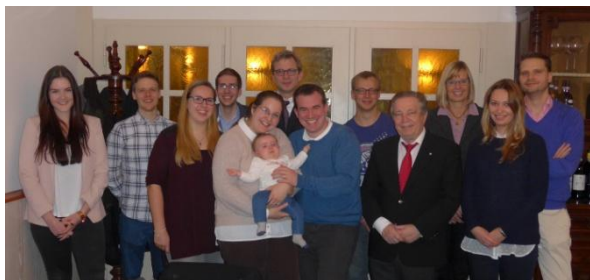
Besuch beim RAC Offenbach am 2.2.2016