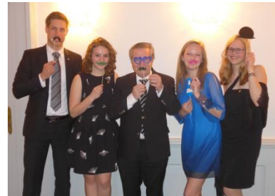
Charterfeier des RAC Bad Homburg

Allen Mitgliedern der Rotaract Clubs habe ich bei meinen Besuchen immer wieder die Frage gestellt: Was ist Ihre Motivation Rotaracter zu sein? Und die Antworten waren durch die Bank weg: Freundschaft mit anderen Gleichgesinnten und die Mitwirkung beim Kidscamp. Beim Wort Kidscamp begannen die Augen zu leuchten: „Denn auch wenn wir dort viel Zeit investieren, wir bekommen mehr zurück, als das was wir geben“. Gibt es einen besseren Grund für die Rotary Clubs das KidsCamp auch im Jahr 2016 zu unterstützen?